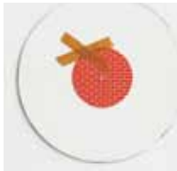
Hausgemachte Platten XII 12/02 Schallplatte, Kreidegrund, d-c-fix, Klebeband Durchmesser 30 cm, WVZ 02029