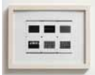
Murphy I, III-IX 01/11 Fotogramm, Klebeband, Karton, Rahmen je 18 x 24 cm, WVZ 11002/4-10