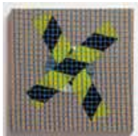
Multiple_2005 10/05 Spanplatte, Warnband, CD-Rohling, Baugewebe je 30 x 30 x 1,9 cm, WVZ 05024 Multiple: Auflage 5 Stück